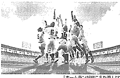
「ホームランが聞こえた夏」より

8月は夏休み特集で2本の映画をご紹介します。1本目は韓国に実在するろう学校の野球部で起こった実話をベースにした映画「ホームランが聞こえた夏」。2本目は監督マイケル・ベイによる、全世界で7億ドル以上の興行収入を記録したシリーズ3作目「トランスフォーマー」。